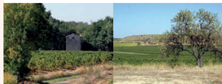
Pigeonnier les Colombades