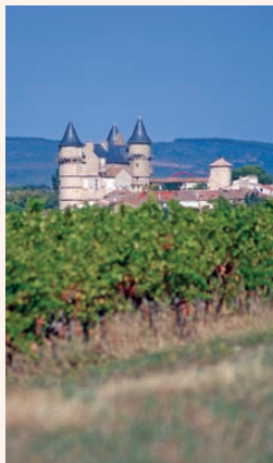
Château de Margon