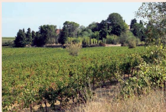
Domaine de Montarel